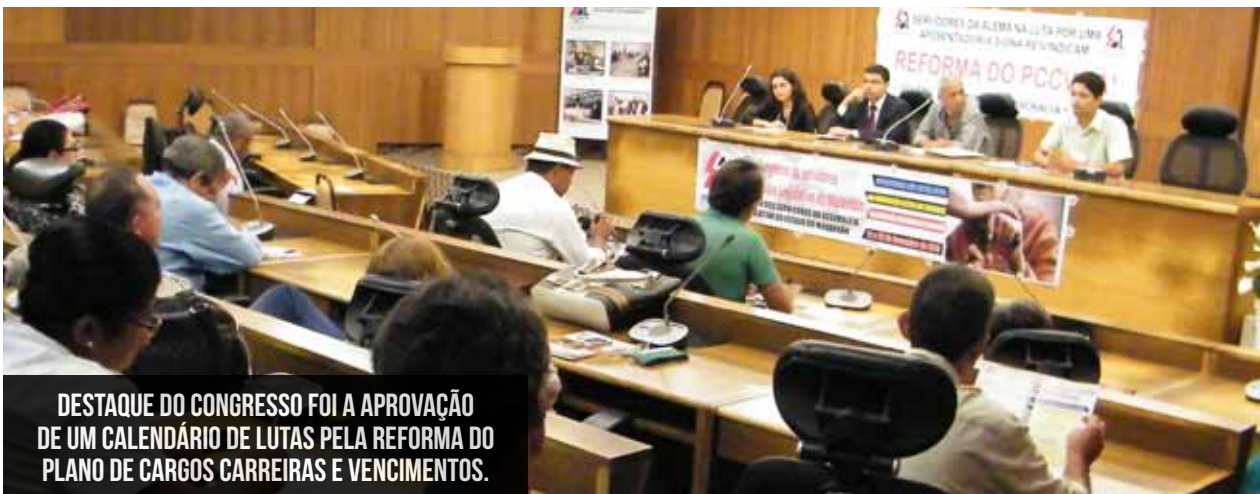
DESTAQUE DO CONGRESSO FOI A APROVAÇÃO DE UM CALENDÁRIO DE LUTAS PELA REFORMA DO PLANO DE CARGOS CARREIRAS E VENCIMENTOS.

O 5º Congresso dos Servidores da Assembleia Legislativa do Maranhão (CONSALEM) foi realizado nos dias 21 e 22 de novembro, no Plenário Gervásio Santos, na sede da ALEMA, em São Luís.