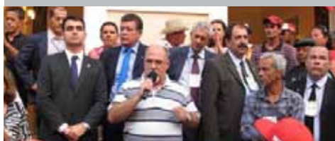
AO CONTRÁRIO DE ANOS ANTERIORES, SINDICATO TEVE PARTICIPAÇÃO EFETIVA.